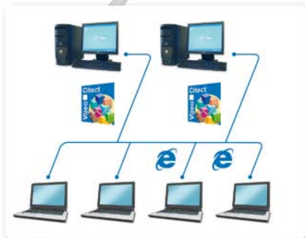
Redundante architectuur met 2 servers en 2 Web Clients