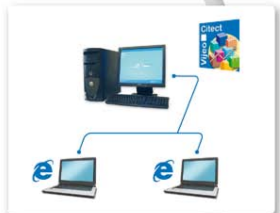
Singleserver-architectuur met 2 Web Clients