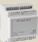
IHC besturings- systeem