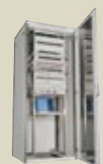
LexCom Office patchkast