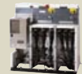
RM6 Ring Main Unit