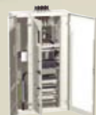
Prisma Plus P verdeelinrichting

De producten van Schneider Electric zorgen voor veel comfort en veiligheid en besparen veel bedrijfskosten.